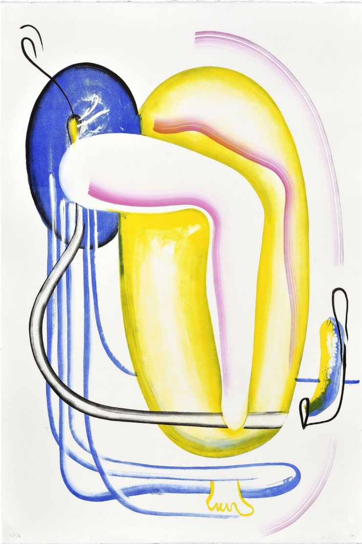
© Io Burgard, La jambe au lever, 2023, crédit photographique Philippe Rolle

L'exposition Les temps changent questionne notre rapport au temps, au présent, à l'avenir.