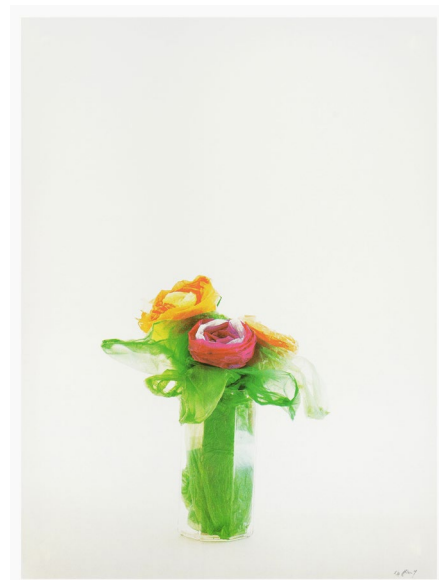
@ Paul Pouvreau, Les Permanentes, 2023

Toutes ces questions sont susceptibles de nous permettre d'imaginer des perspectives qui tiennent à l'imaginaire comme à la réalité et de voir comment, du point de vue des artistes, « les temps changent... »